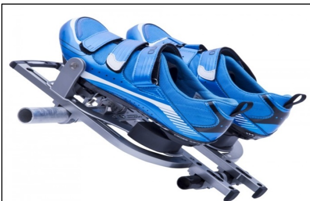
Figure 2. Exemple de cale-pieds dont les chaussures ne demeurent pas dans le bateau

Les talons des chaussures de ces cale-pieds NE DOIVENT PAS être attachés puisque cela irait à l'encontre des mesures de sécurité prévues par ce type de cale-pieds. Les chaussures sont censées sortir du bateau avec l'athlète.